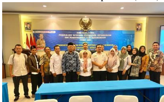
Gambar 3.3 Kegiatan Bimbingan Teknis (BIMTEK) Oprator Kios e-Pak Ladi di Kabupaten Pasuruan