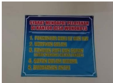
Gambar 3.1 Persyaratan Pelayanan di Kantor Desa Wonokoyo