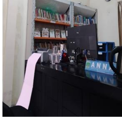
Gambar 3.4 Aktivitas Pelayanan yang dilakukan oleh Oprator Kios e-Pak Ladi