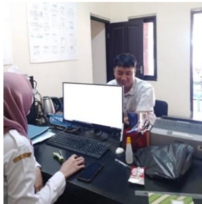
Gambar 3.5 Oprator Kios e-Pak Ladi Saat Memberikan Pelayanan Dengan Penampilan Rapi dan Sikap Ramah